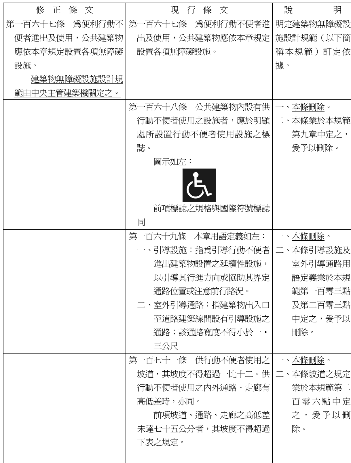
建築技術規則建築設計施工編部分條文修正草案條文對照表